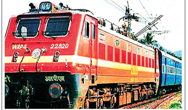
ललितपुर। झांसी से लखनऊ जाने और लखनऊ से वापस आने वाली इंटरसिटी एक्सप्रेस को ललितपुर से चलाए जाने की मांग काफी समय से की जा रही है। गाड़ी संख्या 11109 व 11110 को ललितपुर से चलाए जाने के संबंध में रेलवे विभाग द्वारा भी कई बार समाचार पत्रों में बताया गया कि यह गाड़ी ललितपुर से जल्द ही चलाई जाएगी। लेकिन अभी तक इस गाड़ी के बारे में कोई भी जानकारी प्रदान नहीं हो सकती है कि कब तक ललितपुर से यह गाड़ी चलाई जाएगी।